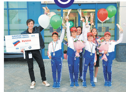
В 2018 году россияне вернули себе звание лучших в Европе.

В этом европейском конкурсе россияне участвуют с 2002 года и регулярно занимают там призовые места. В 2010, 2011, 2015 и 2018 годах российские юидовцы становились лучшими в Европе! А в 2015 и 2018 годах – две российские команды занимали первое и второе места!