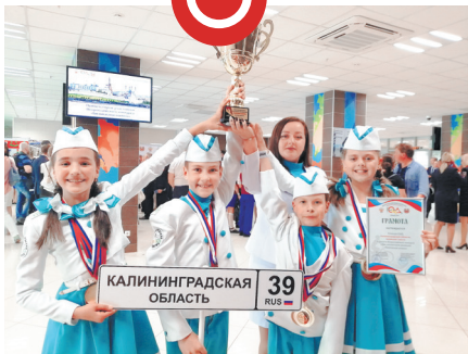
Команда Калининградской области – победитель «Безопасного колеса – 2019»

Сегодня «Безопасное колесо» — главное событие в жизни каждого юидовского отряда. Конкурс проходит на всех уровнях — школьном, районном, областном, региональном. А лучшие из лучших — победители региональных конкурсов — принимают участие во всероссийском «Безопасном колесе».