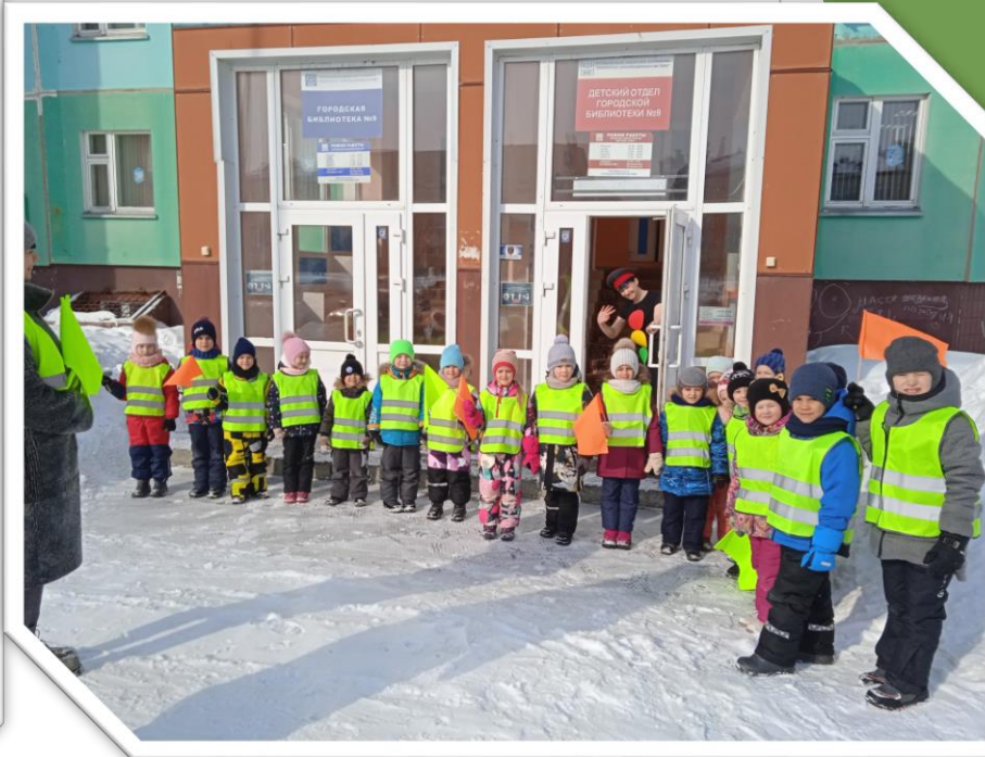
«Дошли до библиотеки №9 по улице Романтиков 9»