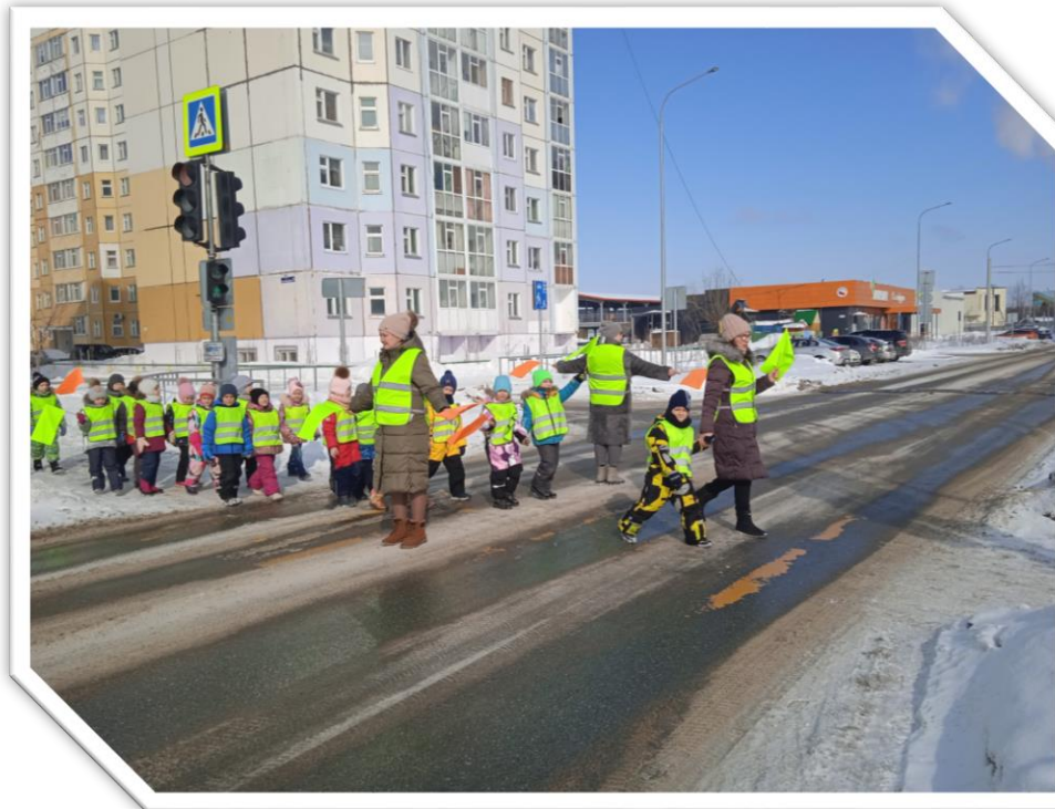
Переходят по пешеходному переходу со светофором по улице «Романтиков»