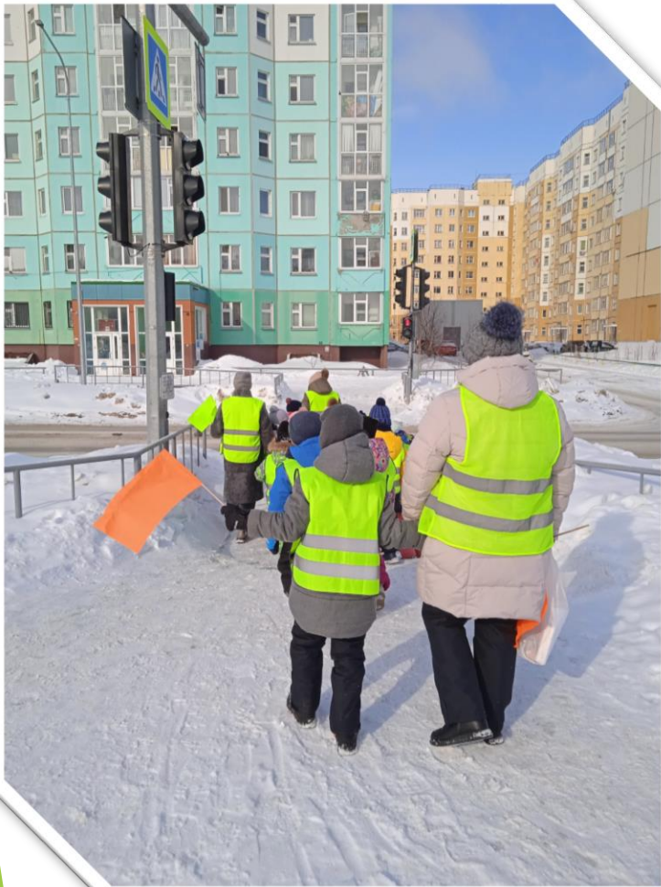
Дошли до пешеходного перехода со светофором по улице «Романтиков»