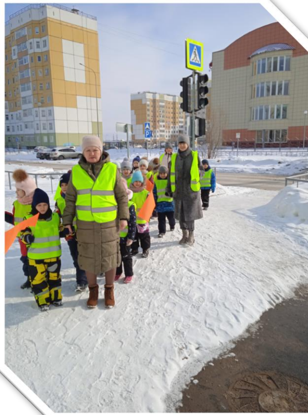
Перешли пешеходный переход со светофором по улице «Романтиков»