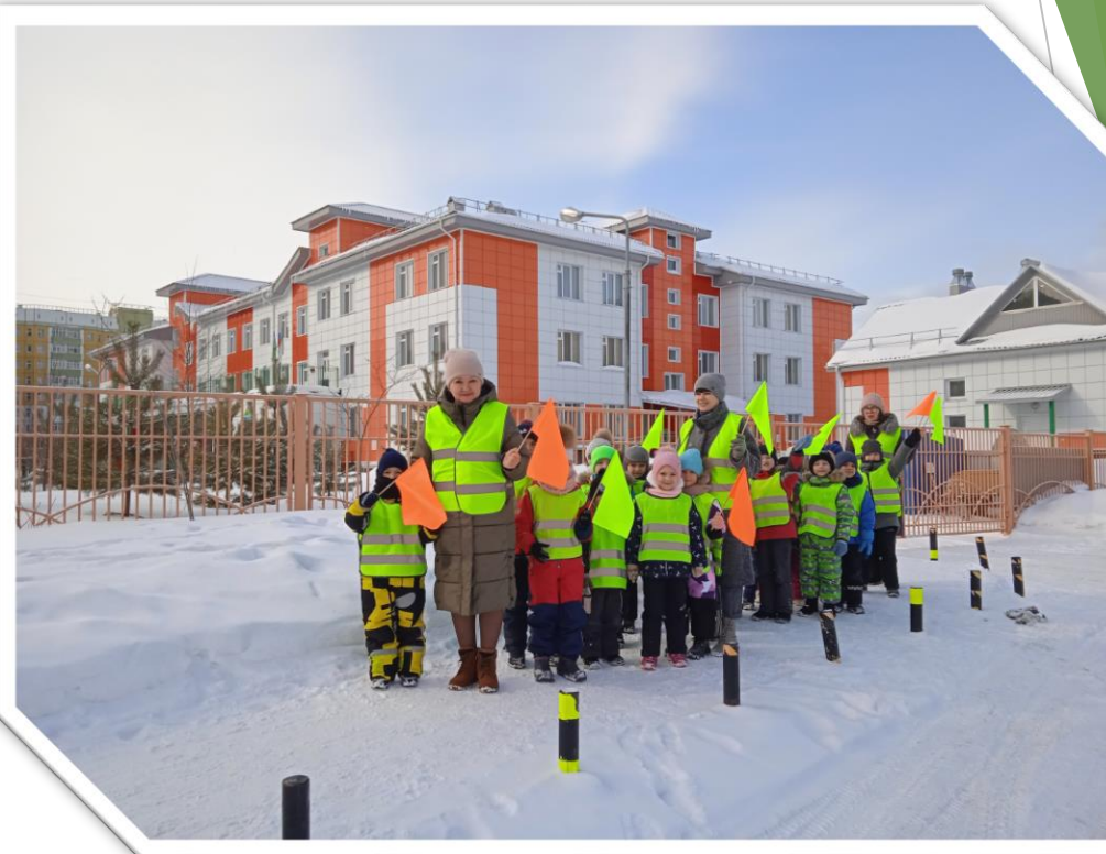
Двигутся по пешеходному тротуару «Романтиков 14»