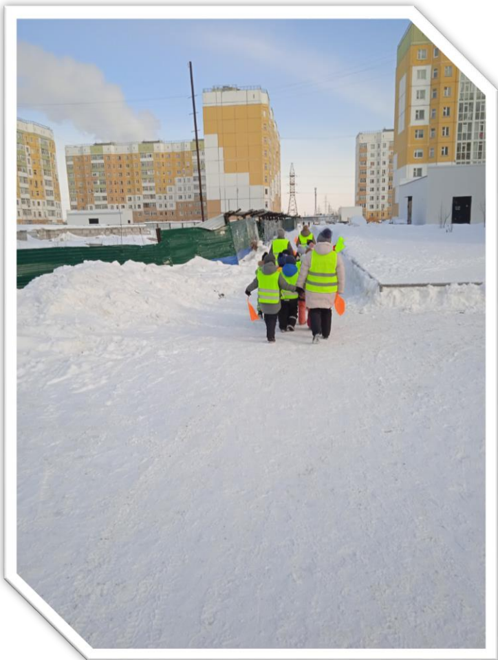
Двигутся вдоль жилой постройки