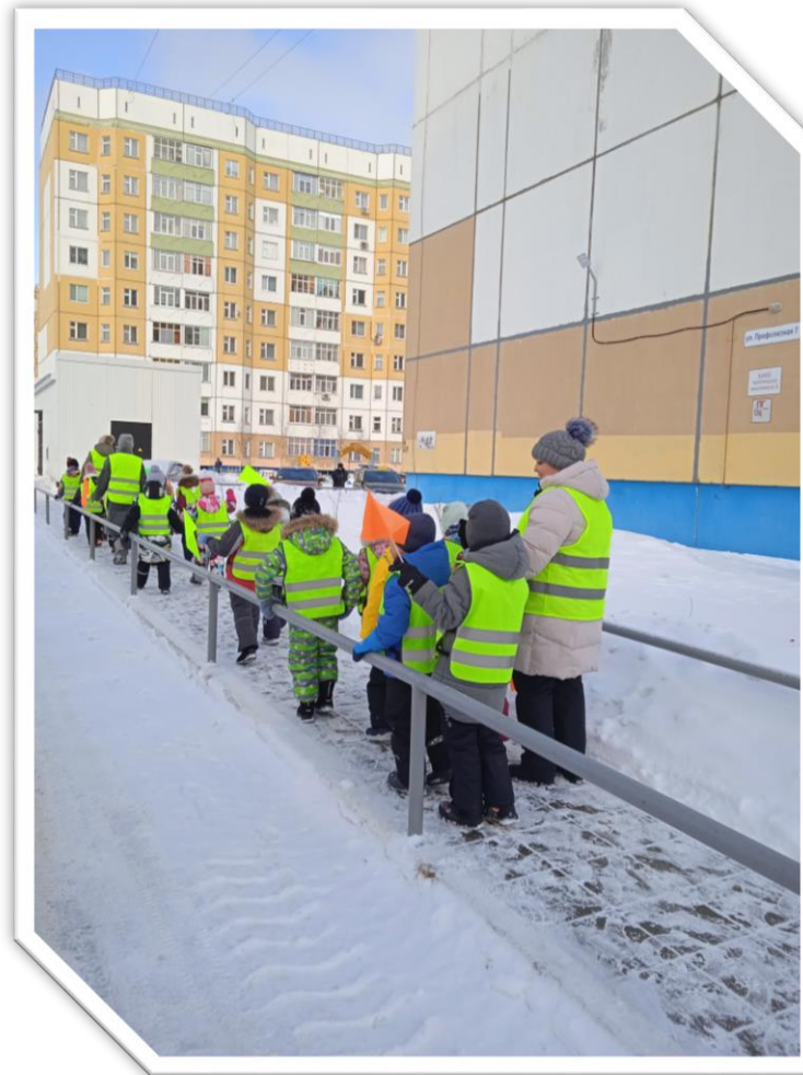
Двигутся по пешеходному тротуару возле дома по улице «Профсоюзная 7»