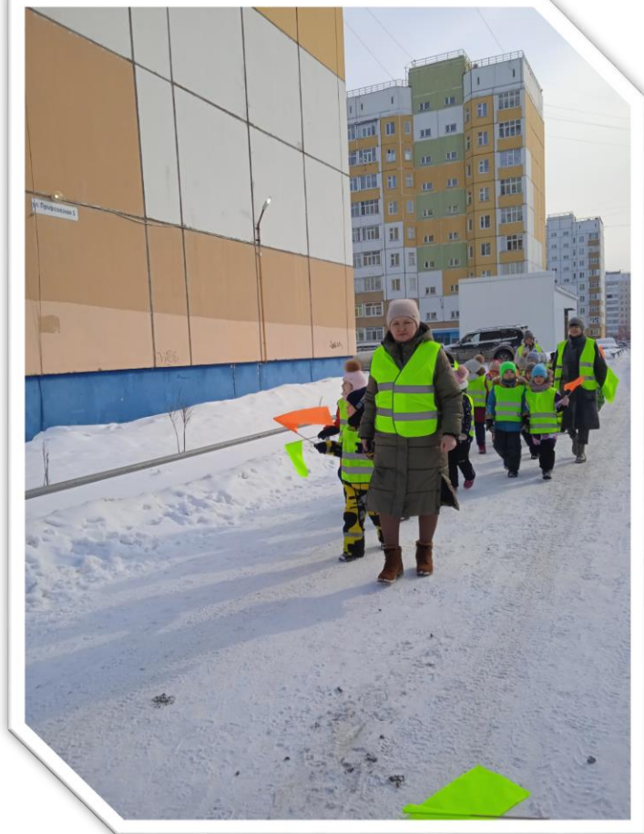
Двигутся по пешеходному тротуару возле дома по улице «Профсоюзная 5»