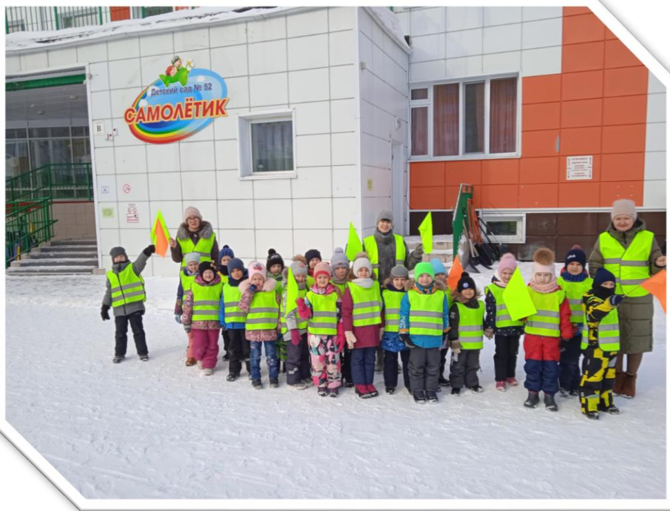
Выход из МАДОУ ДС «52 «Самолётник»