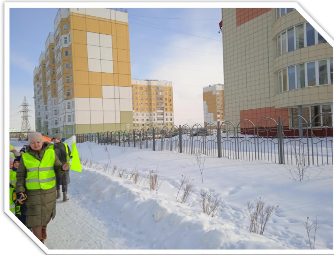
Двигутся по пешеходному тротуару в сторону «Лицея №1 имени Пушкина»